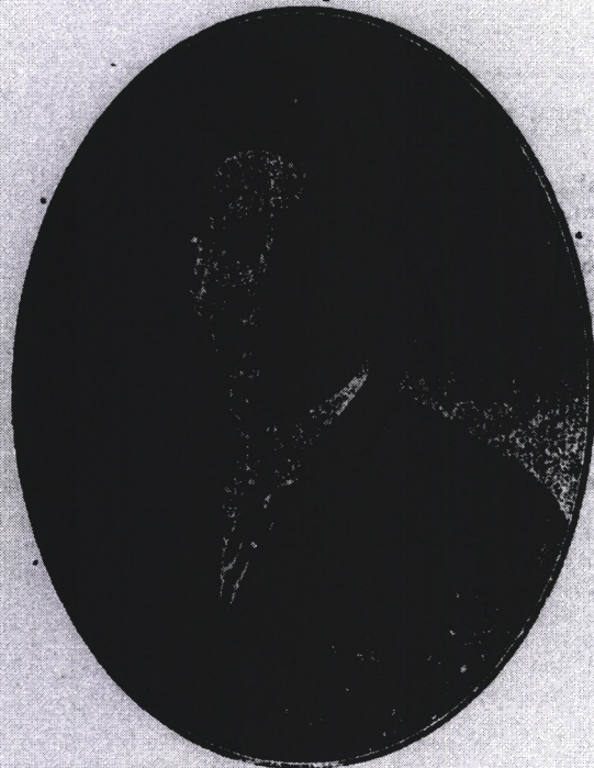
Candidato regional a senador para el periodo de 1921 A 1927